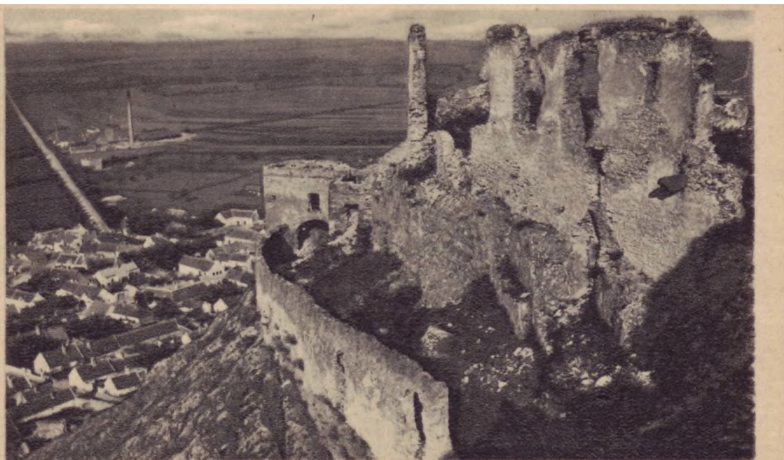
SÜMEGE. Mária kegyhely.