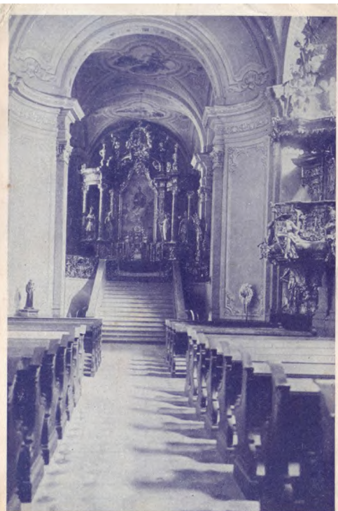
TIHANY. AZ APÁTSÁGI TEMPLOM FŐOLTÁRA.

Vándor fafaragó járta a vidéket, munkát keresett.