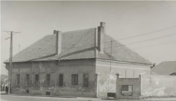
Lebontva 1974-ben.

Építési idejét a XIX. század elejére keltezik. Nevének eredete nem ismeretes, bár ez kedvelt vendéglői, éttermi név volt szerte az országban. Az épület a Búzapiac tértől keletre, a Palotai út sarkán működött. Ma park áll a helyén vízmedencével. Beszálló vendéglő volt, és az udvarban levő kocsiszínekben elhelyezhetők voltak a vásárra, vagy piacra érkező fogatolt járművek.