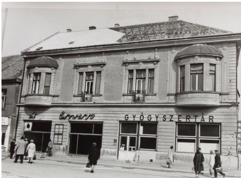
A Kossuth u. 21. sz. épület.

Az 1893-as nagy tűzvész után a századfordulón épült kétszintes, vakolatdíszes, két zárterkéllyel épült szemrevaló polgári ház volt. Földszintjén üzlethelyiségek voltak, emeletét a Rothauser-család lakta. (1)