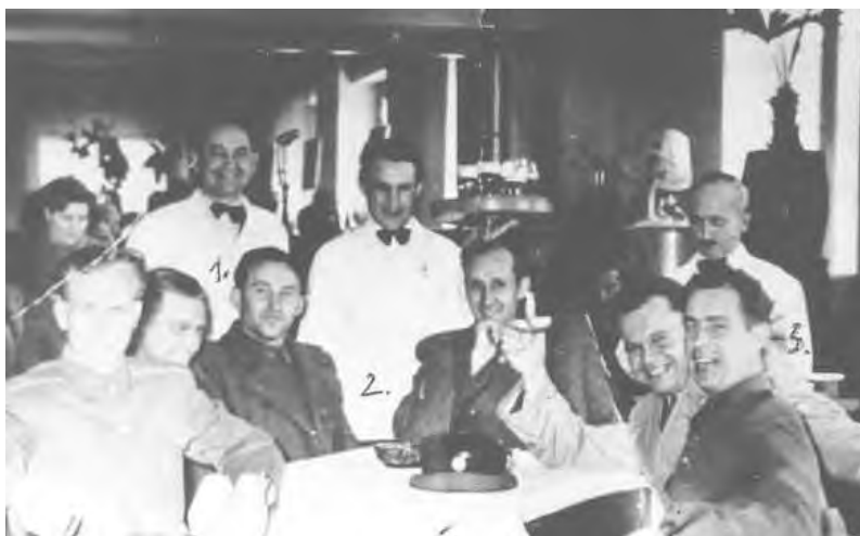
A Bakony étterem pincérei, 1955.