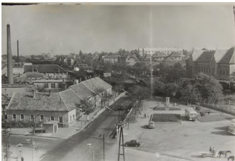
Palotai tér 1. szám.

Beszálló vendéglő volt a Jutasi út sarkán, az akkori Búzapiac tér közelében. Az épületben tíz vendégszoba állt az utazók rendelkezésére, a piacra jövő kereskedők és fuvarosok lófogatai számára pedig az udvarban megfelelő szálláshely-istálló volt biztosítva. Az épület keleti felében a szálloda, nyugati felében a söntés és étterem működött. Kitűnő konyhát vezettek, s az ételek mellé balatoni és somlói bor volt kapható.