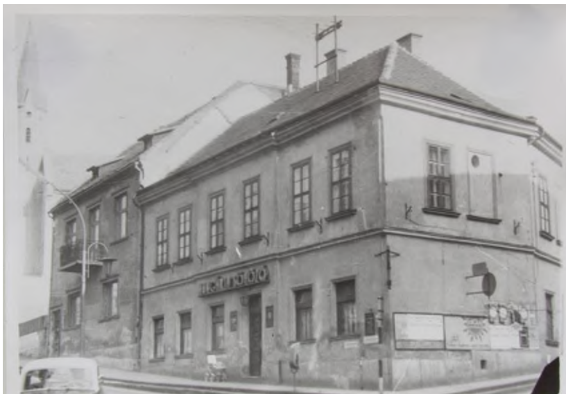
A Hungária Söröző épülete. (Fotó: Wöller I. 1958.)

A patinás Hungária név felvétele, és a vendéglő megnyitásának időpontja egyelőre nem ismeretes. A kétszintes épület a Kossuth Lajos utca és a mai Brusznjai Árpád – korábban Szabadi út, Horthy Miklós utca, majd Bajcsy-Zsilinszky – utca sarkán állt.