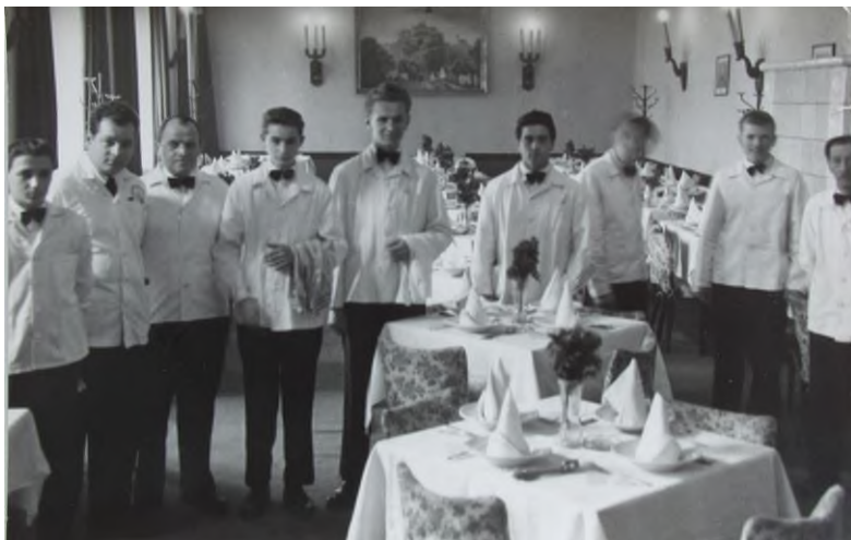
A Bakony étterem ifjú pincérei oktatóikkal (kb. 1960)