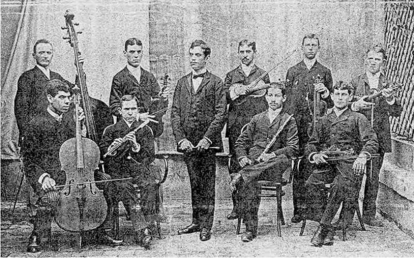
Ismeretlen veszprémi zenekar az 1890-es évekből