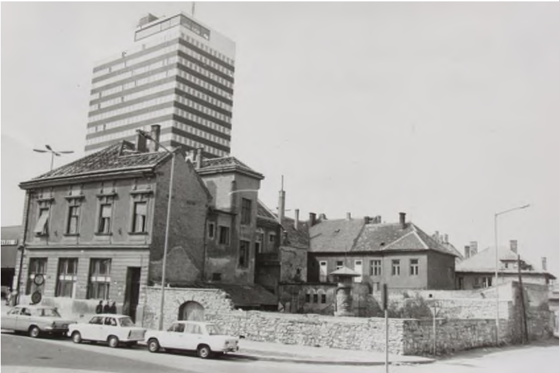
A Balaton cukrászda nyári kerthelyisége.

Fiatalok és középkorúak részéről egyaránt nagyon közkedvelt, kulturált, zenés szórakozóhely volt. A Kossuth Lajos utca felőli bejárat előterében volt a kiszolgáló pult a raktárakkal, onnan téglalakú nagy terembe léptünk, melynek északi végében egy szűk és sejtelmes világítást adó táncterembe jutottunk. Innen volt a kijárat a négyzet alakú kerthelyiségbe, melynek fából készült lugasait bakonyi jellegű fafaragásokkal díszítették. Nyáron minden lugas (box) mellett futórózsabokor és egyéb szezonvirág díszítette a kerthelyiséget, melynek közepén táncparkett, s ennek centrumában egy gombaszerű oszlop állt. (2) E körül táncoltak. Sok-sok ezer ember számára maradt felejthetetlen élmény mind a Balaton belsőhelyiségeiben, mind a kerthelyiségben eltöltött idő.