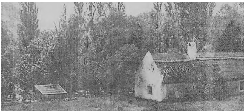
Kiskúti Csárda az 1900-as évek elején.

A kirándulásra mindig alkalmas Betekints völgy távoli hajlatában, a dombok széltől védett lábánál, szép környezetben fekszik az egyik legromantikussabb kerthelyiséges vendégfogadó a Kiskúti Csárda. Korábbi neve Zsidócsárda volt.