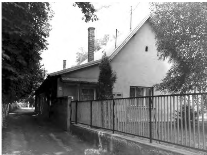
A Kiskúti Vendéglő napjainkban (2002.)

Az épület állagában az újjáépítés során csak annyi történt, hogy a mennyezeten nem lóg füstös petróleumlámpa, vizet nem a Sédről hordanak, és a söntés mellett lévő belső helyiség ma már lakószoba. Az épület déli oldalán végigfutó nyitott verandát befalazták és ma ez a helyiség az ivó. A söntésből a domboldal gyomrába nyílik a lejárát egy hatalmas méretű pincébe, mely műemlékvédelmi felügyelet alatt áll.