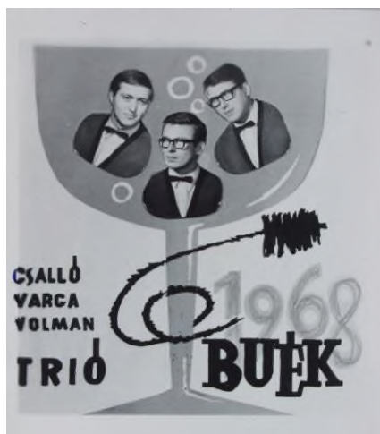
B. U. É. K. 1968. A Csalló trió