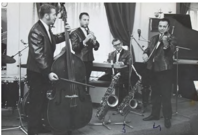
A Károlyi zenekar tagjai