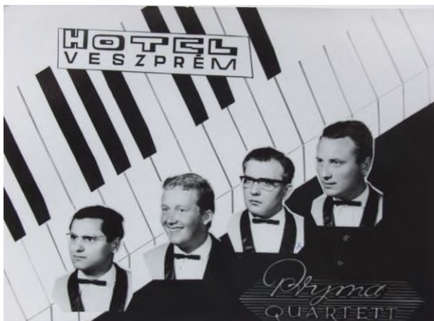
A Pryma zenekar tagjai (1967)

A háromcsillagos Hotel a megnyitása óta egyúttal zenés szórakozóhely volt, és ma is az. A 150 személyes éttermükben cigányzenekart nem foglalkoztatnak, inkább a dzsessz zenekarokat részesítik előnyben.