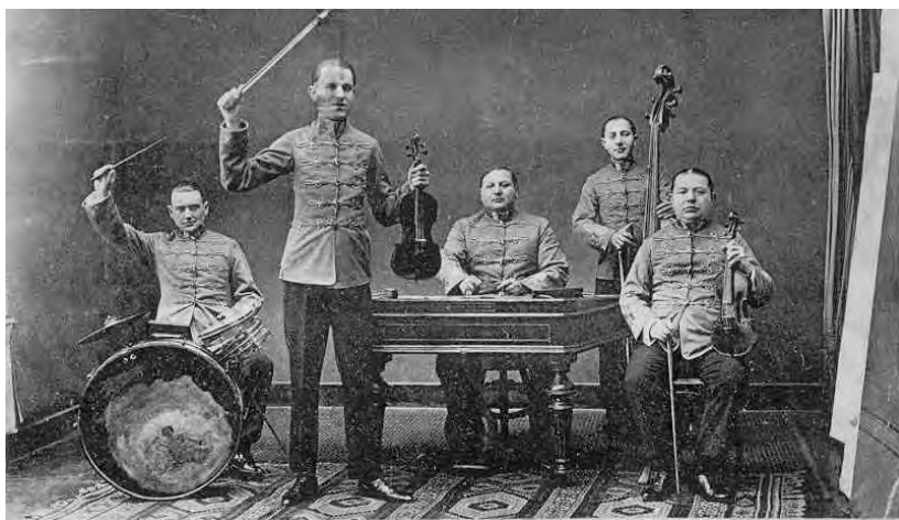
Kurucz N. primás és zenekara, Würzburg, 1928.