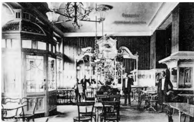
Az Elit kávéház belseje 1908-ban.