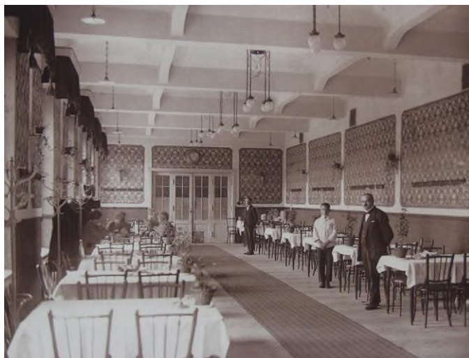
A Korona szálló étterme az 1930-as években