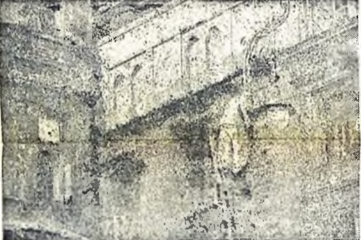
Már a kora délutáni órákban sötétedik — sötétben nem szívesen mennek az utcára az emberek. A közvilágítás rendezése az egyik első feladat. Itt már megkezdtek.