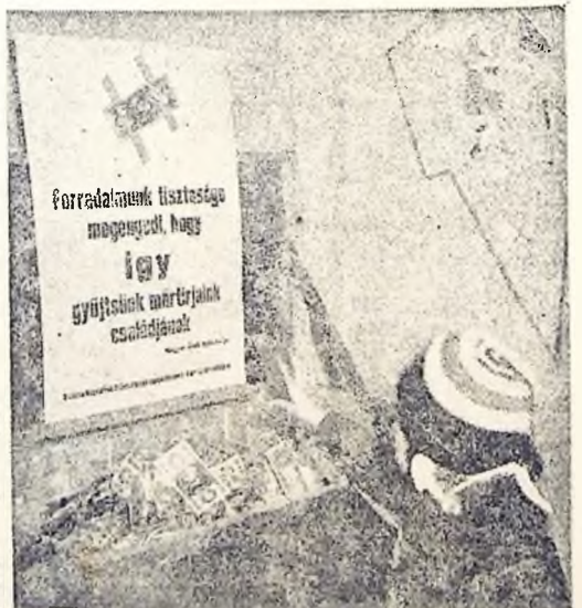
»Forradalmunk tisztasága megengedi, hogy így gyűjtsünk marékjaink csatlóidjaink.« Aláírás: Magyar Ifrök Szövetsége — hirdeti szerte a városban a plakát. A nyomtatványra egy százfórtost ragasztott valaki. Alatta zúd ládikó, s ebbe percrelő-percre hullik a pénz. Már telik a láda, de senkinek sem jutna észébe, hogy hozzányúljan. — pedig nem őzi senki sem. Fenti képünk a Itákői út és Körút sarkán készült