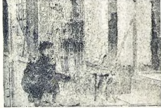
Megindultak az őszi esők, sok a javításra váró cipő. Ez a kisiparos szorgalmasan netijogott a munkához — egyelőre a műtény helyrehozásához.

Senki nem szervezte, magától, élni akarásból, segített akarásból született az első néhány darabka rend. S így születik majd a nagy, szép rend is: a szabadság.